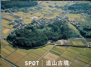
SPOT | 造山古墳