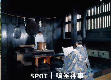
SPOT | 鳴釜神事