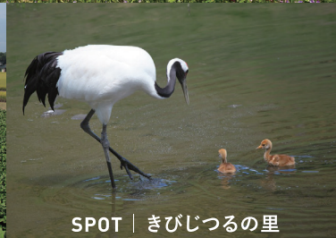
SPOT | きびじつりの里