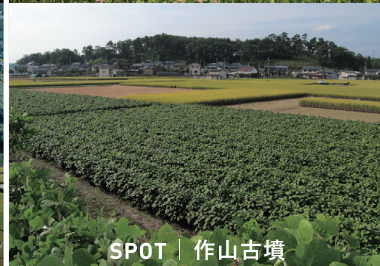
SPOT | 作山古墳