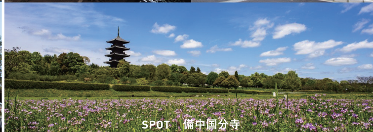
SPOT | 備中国分寺