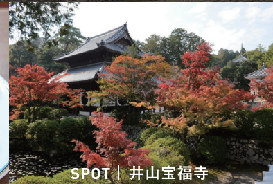
SPOT | 井山宝福寺