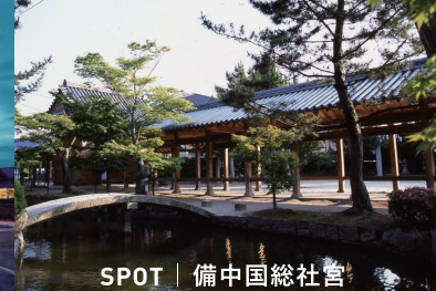
SPOT | 備中国総社宮