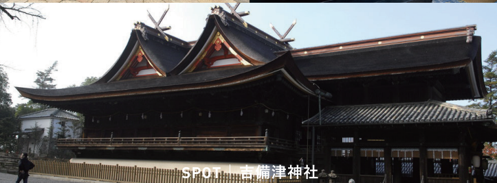
SPOT | 吉備津神社