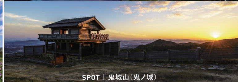
SPOT | 鬼城山(鬼ノ城)