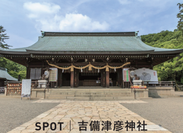
SPOT | 吉備津彦神社