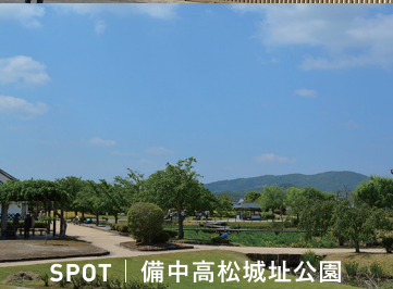
SPOT | 備中高松城址公園