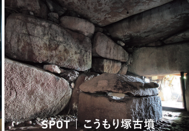
SPOT | こうもり塚古墳