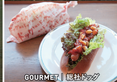
GOURMET | 総社ドッグ