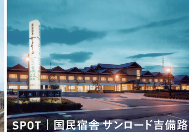
SPOT | 国民宿舎 サンロード吉備路