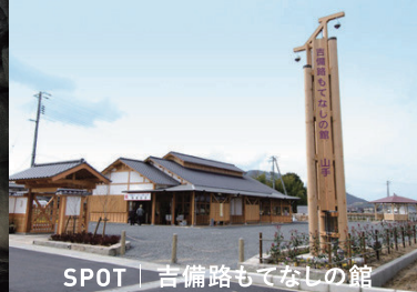
SPOT | 吉備路もてなしの館